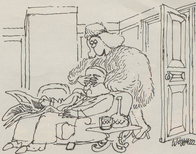
«Ein Pelz. Kein Kaninchen; er kostete nicht nur 200 Franken; er stammt nicht aus einem Warenhaus – rate!»