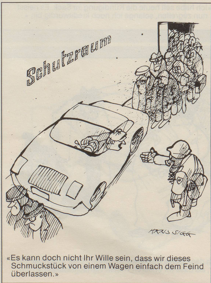
«Es kann doch nicht Ihr Wille sein, dass wir dieses Schmuckstück von einem Wagen einfach dem Feind überlassen.»