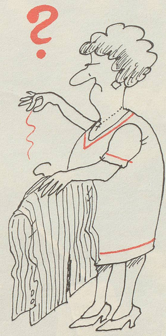
Gattin Ständerat XAN.....