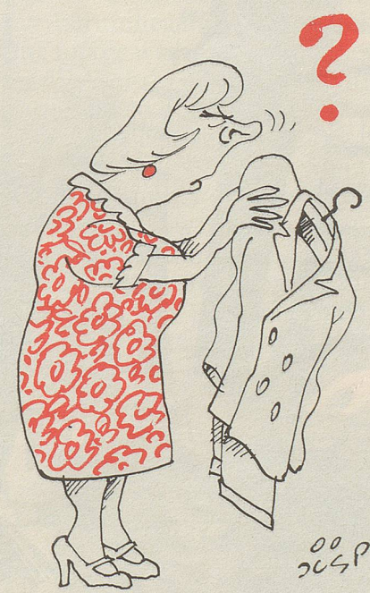
Gattin Nationalrat A.....