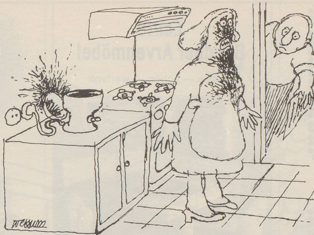
«Ich wollte chinesisches Püree machen, vergass aber, dass der Mixer aus Taiwan ist!»

Mein Plus: Trotz besseren Wissens, dass man nicht über seinen Schatten springen kann, bin ich nicht ausgesichert. Der rechnerische Sinn für eine ausgewogene Bilanz verschafft mir als Fazit die Überzeugung, dass, falls es ein Nächstesmal gibt, ich die Situation nach meinen Wünschen zu drehen berechtigt bin. Einen kleinen Haken hat die Sache allerdings: In welcher Ehe, die diesen «Namen» verdient, pocht man schon auf sein Recht? Gritli