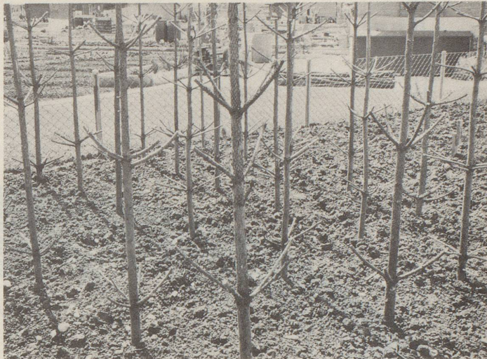
... als Bohnenstangen