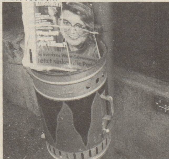
Das hat sie nicht verdient!