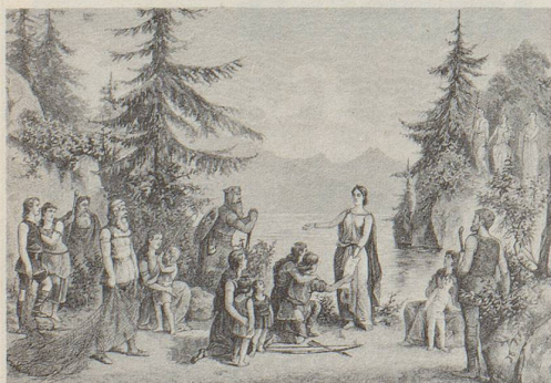
Im Festspiel-1891-Prolog werden drei helvetische Familien auf Heimatsuche am Ufer des Vierwaldstättersees von der Freiheit begrüsst. Im Hintergrund rechts oben assistieren die allegorischen Damen «Ordnung», «Recht» und «Genuss» (!).