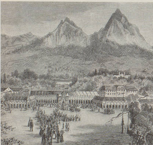
Am Fusse der beiden Mythen hatten die Schwyzer zur Feier der 600jährigen Eidgenossenschaft eine Festhüttenzenerie aufgebaut. Jeweils 11 200 Zuschauer betrachteten sich das grosse Festspiel, dargestellt von 750 Erwachsenen und 170 Kindern.

Bald nach dem Jubiläum wurde ein Verein gebildet, «um den Festplatz käuflich zu erwerben und für alle Zeiten zu sichern.»