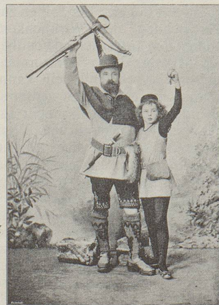
Im Berner Festzug 1891 zeigte sich Wilhelm Tell samt Knabe und Apfel der «jubelnden Festgemeinde».