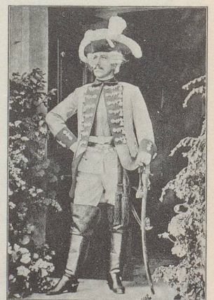
Auch General Rupertus Scipio von Lentulus, ein Berner Söldner im Dienste Friedrichs des Grossen, marschierte munter mit. Der 1714 geborene Haudegen wurde sogar von Voltaire mit einem Vers beehrt, war Träger hoher russischer und preussischer Orden und wurde 1786 auf Monrepos begraben. Lentulus-Rain und Lentulus-Strasse erinnern noch an ihn. Die 1891er Festivitäten schlossen derart auch die eidgenössische Präsenz im Ausland ein.