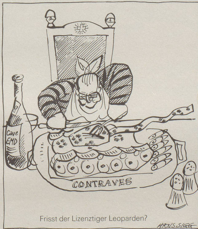
Frisst der Lizenztiger Leoparden?