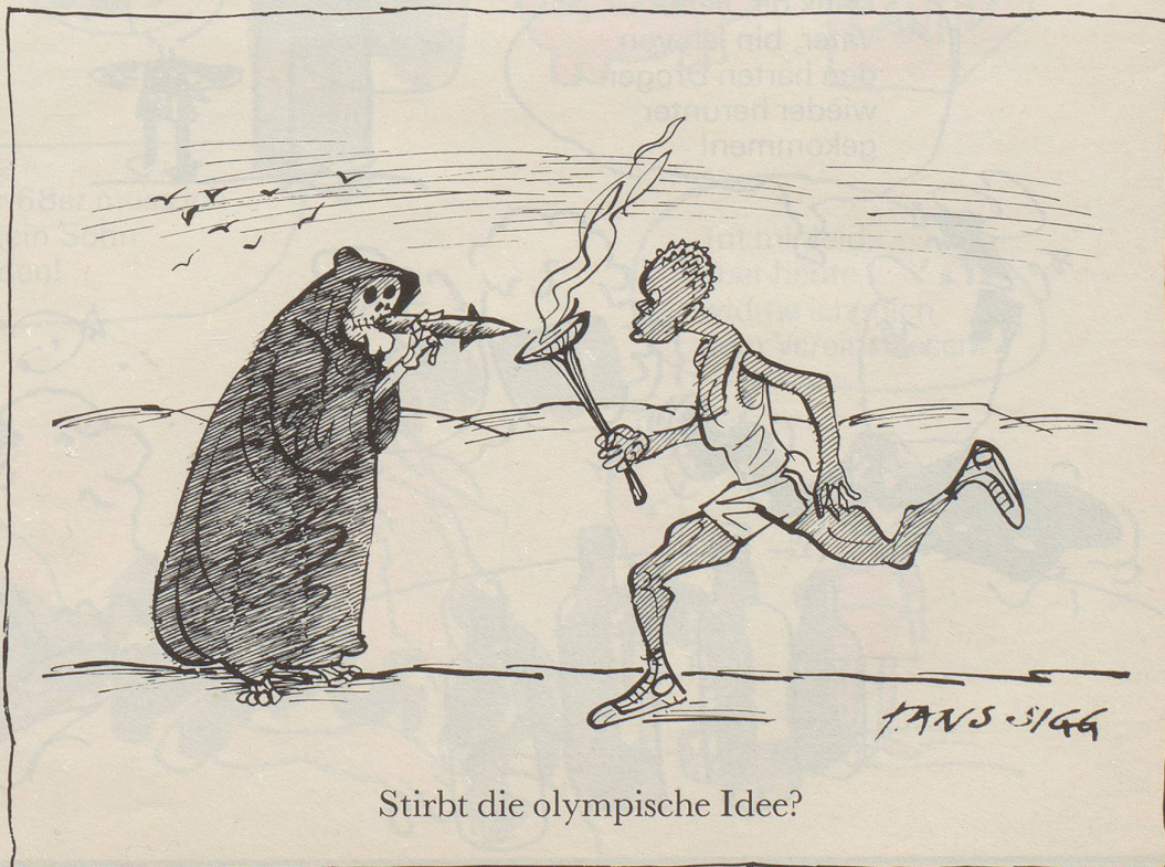
Stirbt die olympische Idee?

Es wird behauptet, der menschliche Körper gleiche einer menschlichen Fabrik. Wie fahrlässig diese Gleichung aufgestellt worden ist, sieht man daran, dass man sie auch mit viel Sophistik nicht umkehren kann.