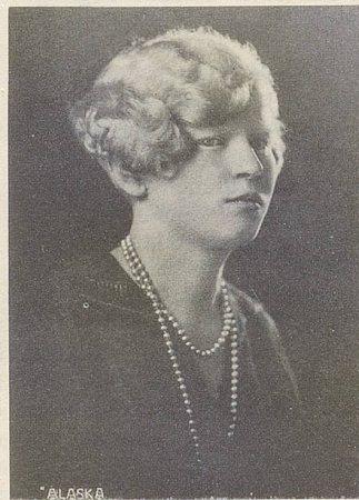
Sie war besonders vielseitig: Unter dem Namen «Alaska» trat diese junge Dame um 1912 als Albino-Lady «mit den weissen Haaren und den roten Augen» auf und übte sich coram publico in Graphologie und Chiromantie.