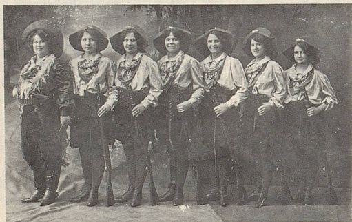
Stramm und fröhlich stehn sie da, die sieben Girls aus USA: Links grinst die bärenstarke Bossin, rechts grüsst die kleinste Schiessgenossin. Sie alle trafen – zwar mit Scherzen – doch tief in Schweizer Männerherzen!

Es ist uns deshalb eine Ehre und ein Vergnügen, unserer geneigten Leserschaft einige dieser «Topstars» aus der fernsehlosen, guten alten Zeit von 1900 bis 1920 wieder in liebenswürdige Erinnerung zu rufen.