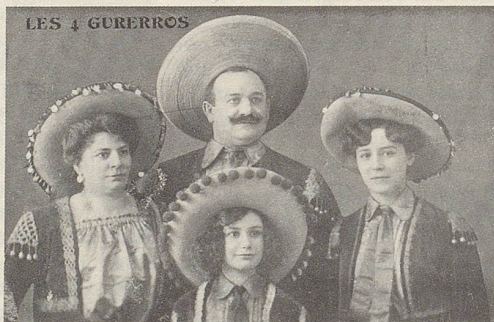
Aus Mexiko kamen die Gurerros zu uns: Vater, Mutter und zwei Töchter. Sie verbreiteten lateinamerikanische Folklore auf eidgenössischen Variétébühnen der Jahrhundertwende.