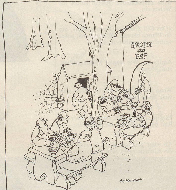
«Diese heissblütigen Deutschschweizer machen wieder einmal einen Saulärm!»

Eigentlich ein wunderbares Instrument, unser Auge. Wo ihm etwas gefällt, da kann es verweilen, sich vertiefen. Und wenn ihm etwas nicht behagt, missfällt, dann kann es ja wegsehen. Jetzt stellt euch einmal vor, dies und das wird immer wüster, aber alle Augen sehen einfach weg... Boris