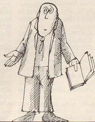
«Sehn oder nicht sehn, das ist die Frage!»