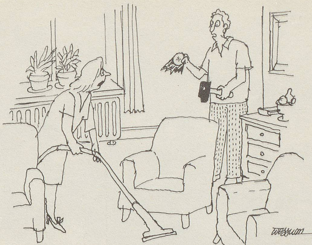
«... und auch weg mit dieser läppischen Vase von Tante Irma. Komisches Fabrikat: Sèvres 1793 ...!»

Nie werde ich einen wohltrainierten, bodygebildeten Körper vorweisen können; ich bin zu faul dazu. Es reicht gerade zu einem anderthalbstündigen Tennis-Mätschen, am liebsten im Doppel, weil's bequemer und gemüthlicher ist, zu einer mehrstündigen Wanderung in den Bergen oder zu ein paar Längen im Schwimmbad, aber – bitteschön – nur kein Gestresse! Es sollte immer noch Spass machen. Ich