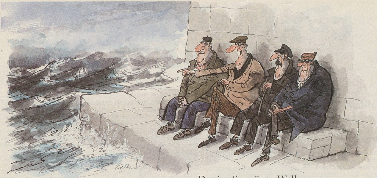
«Das ist die grösste Welle ...»