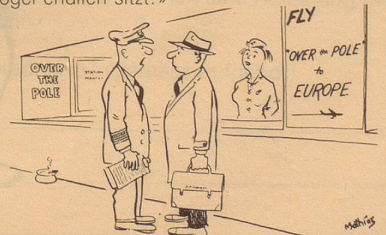
«Ich weiss gar nicht, wie ich's Ihnen sagen soll, aber Ihr Sitz ist nur bis zum Pol confirmed (bestätigt) – und von dort ... waitinglist (Warteliste)!»