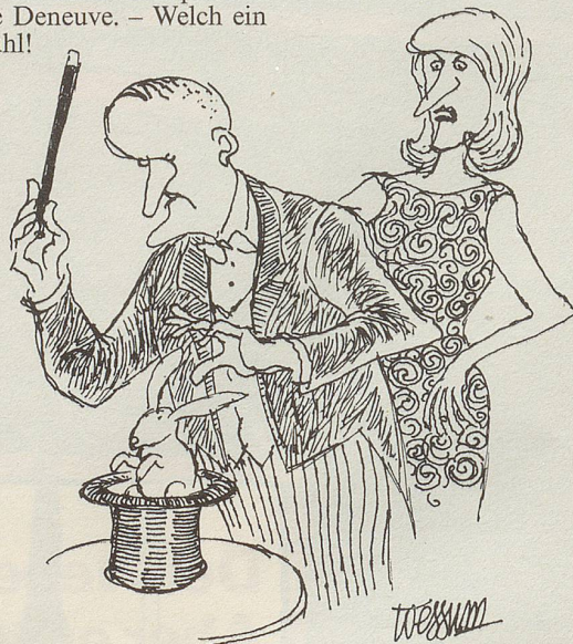
«Kaninchen, immer Kaninchen, wann lernst du endlich, Kalbfleisch und Beefsteaks herbeizuzaubern?»

Mein Mann ging inzwischen längst wieder seiner Arbeit in jenem schönen Land nach, wo der Nebel einen schweren Stand hat, weil er oft gespalten wird. Der gute Gatte rief mich an: «Komm doch nach Hause! Ich bringe dich schon wieder auf die Beine.» Von allzu geschäftstüchtigen und nicht immer allzu gründlichen jungen Ärzten beim nördlichen Nachbarn hatte ich genug, und so flog ich heim.