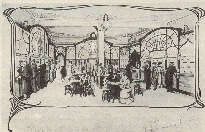
Automatenrestaurant um 1900 an der Zürcher Bahnhofstrasse.