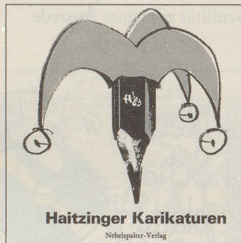
Haitzinger Karikaturen Nebelspalter-Verlag

Horst: Haitzinger Karikaturen 1983 72 Seiten mit 66 Zeichnungen, gebunden, Fr. 15.80