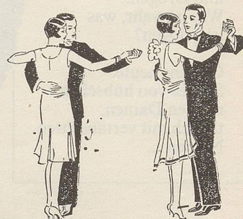
Fig. 40 Fig. 41

*Es wird empfohlen, sich hier der bewährten und noch in fast jedem Brockenhaus erhältlichen 78er-Erfolgsplatte «Billet-doux-Tango» von M. J. Mayson (Phovox 713.854) zu bedienen.