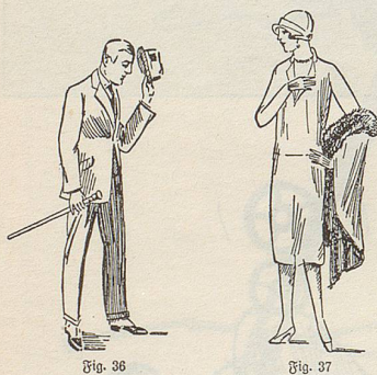
Fig. 36 Verbeugung bei einer Begegnung

Nicht zu verachten ist bereits ein Blick ins aufschlussreiche Vorwort: «... Das Wesen der Neger spiegelt sich in dem Tanz wider, wie das bei allen National-