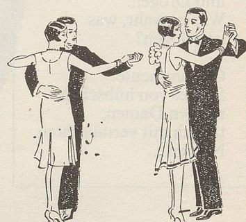
Fig. 40 Fig. 41

*Es wird empfohlen, sich hier der bewährten und noch in fast jedem Brockenhäuser 78er-Erfolgsplatte «Billet-doux-Tango» von M. J. Mayson (Phovox 713.854) zu bedienen.