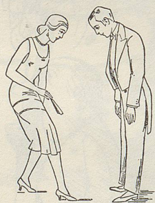
Fig. 38 Damenverbeugung auf der Stelle Fig. 39

«Jedem Tanz zu zweien geht eine Aufforderung zum Tanz, die durch eine Verbeugung ausgedrückt wird, voraus», erinnert uns S. Jaffé. Weiter geht's: «Bei den Gesellschaftstänzen legt der Herr seinen rechten Arm um die Taille der Dame, sie –» Halt, Alfred, um die Taille ! Du weisst genau, wo die Taille ist, viel weiter oben! Ja, dort!