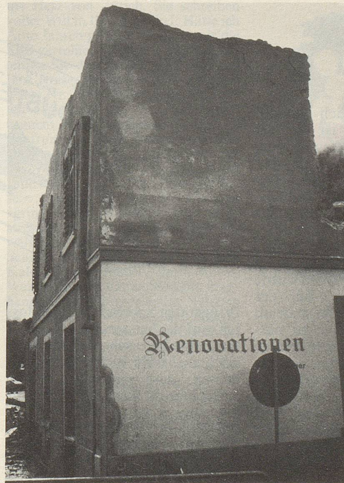
In Chur aufgenommen von Adrian Steiger, Flims

In der nächsten Nummer finden Sie wieder ein