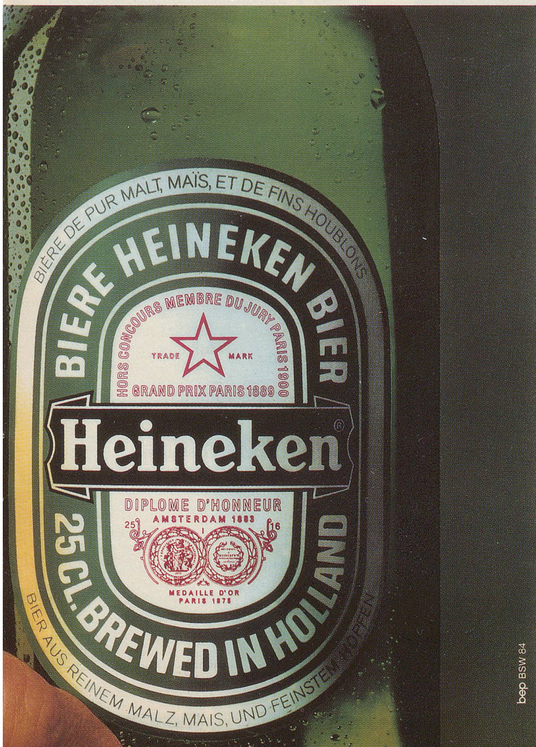
bep BSW 64

«Am besten gefällt mir die Scheibe zwischen den Vorder- und den Rücksitzen», antwortet der Farmer. «Wenn ich die Kälber zum Markt fahre, lecken sie mich jetzt nicht mehr am Nacken!»