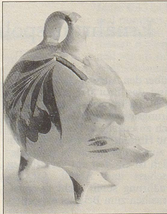
Sparbauch statt Sparbuch