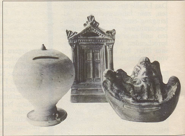
Sparen vor 2000 Jahren