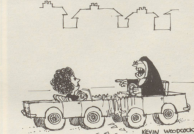
«Natürlich wieder eine Frau am Steuer!!!»

Ich habe ein schlechtes Gewissen, ein sehr schlechtes sogar, und zwar dauernd, immer. Was ich auch tu' und lasse – mein schlechtes Gewissen, aufgeschreckt durch Zeitungen, Zeitschriften, Radio, Fernsehen, verfolgt mich, verdirbt mir das Leben, hindert mich, es zu geniessen.