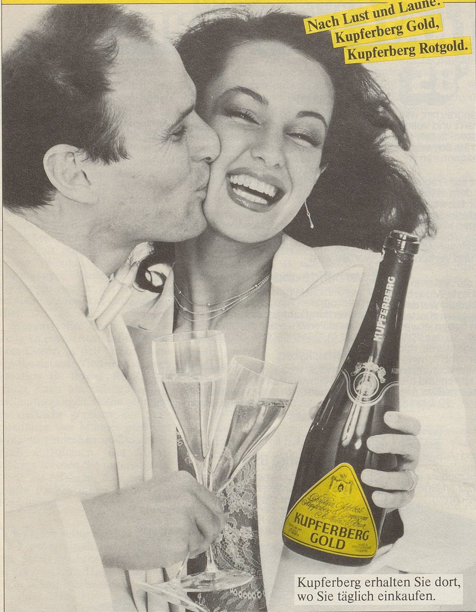
Kupferberg erhalten Sie dort, wo Sie täglich einkaufen.

Nach Lust und Laune: Kupferberg Gold, Kupferberg Rotgold.