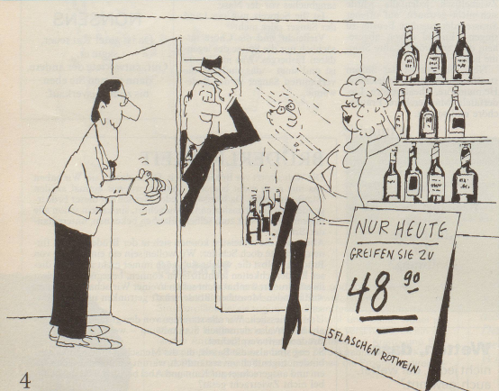
4 Auch die so beliebten Lockvogel-Angebote sind untersagt.