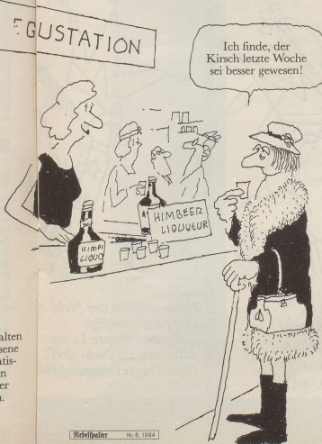
5 Die in der guten alten Zeit gängig gewesene Abgabe eines Gratisgläschens Likör an Kunden gehört der Vergangenheit an.