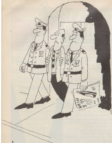
1 Dass das neue Alkoholgesetz (von 1983) seine Tücken hat, erfuhr ein Grossverteiler. Ein Strafverfahren wurde gegen ihn eingeleitet, weil er in einer Zeitungs-Spirituosens-Reklame Preisangaben gemacht hatte.