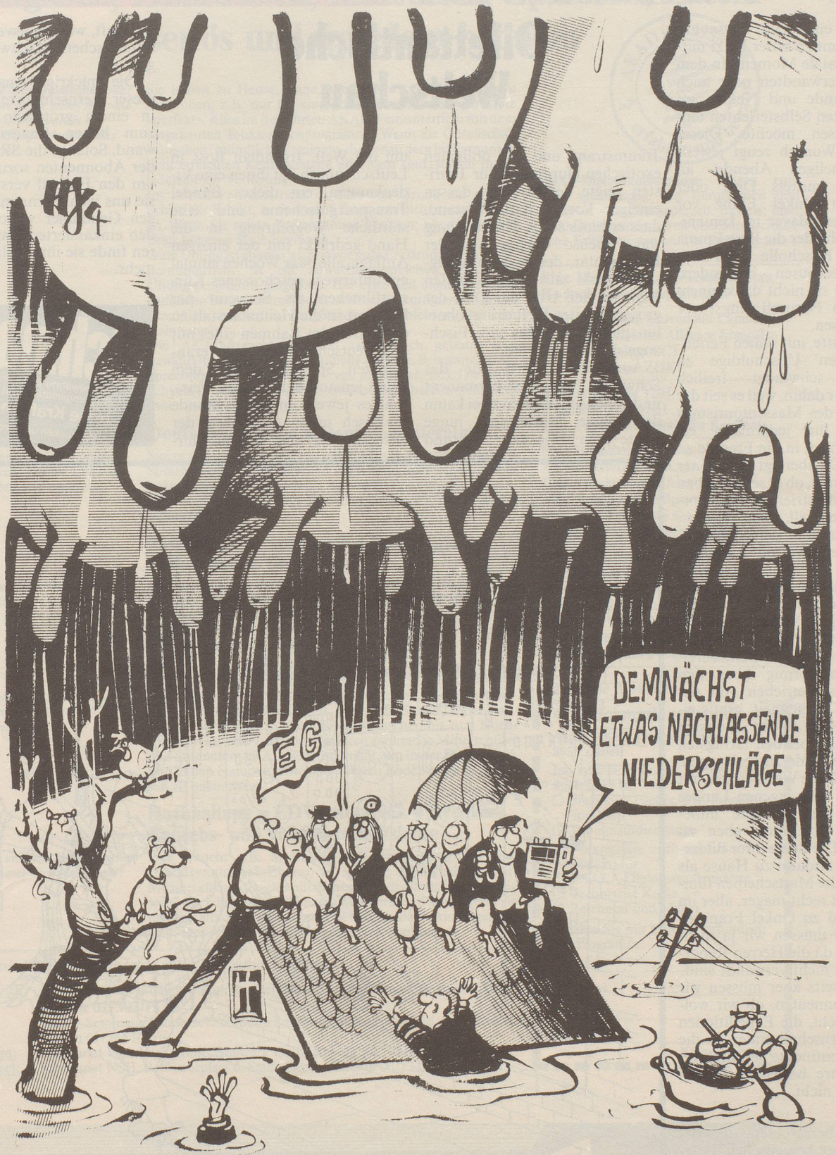
Wetterbericht aus Brüssel