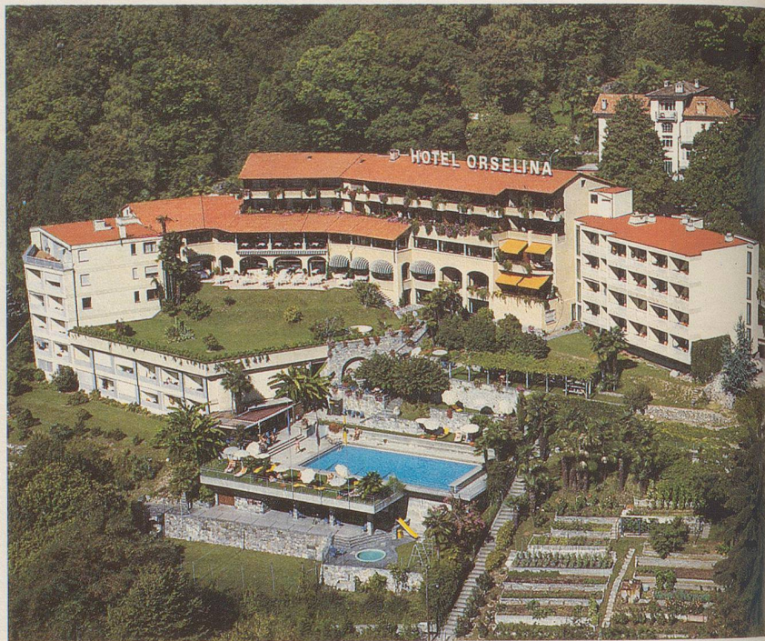
Die prachtvolle Hotelanlage Orselina nach dem Umbau 1984

Ein ungewöhnliches Ferienangebot exklusiv für die Nebelspalter-Leser