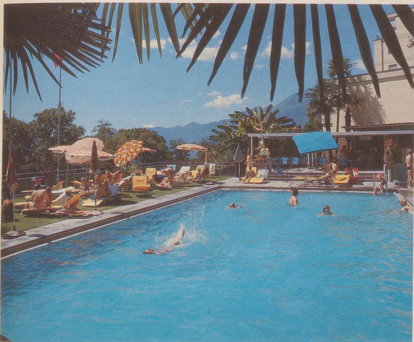
Blauer Himmel, warme Sonne und ein Bad unter Palmen!