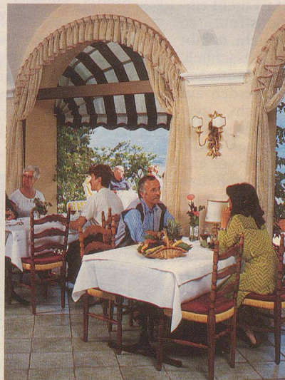
Im stillvollen Restaurant sowie in den mit behaglicher Eleganz eingerichteten Aufent- haltsräumen herrscht eine ungezwungene Ambiance.

Hotel Orselina: ein Begriff für viele Gäste, die Jahr für Jahr in der Schweizer Sonnenstube ihre Ferien verbringen, und auch viele Nebi-Leser kennen den traditionsreichen Familienbetrieb, wo man erholsame, unbeschwerte und erlebnisreiche Ferien geniessen kann.