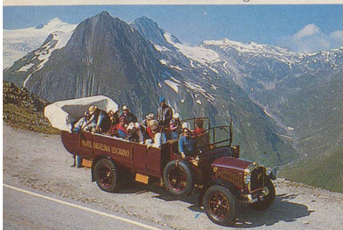
Auf dem Gotthard-Hospiz lädt Hotelier Peter Tresch zu einem frohen Imbiss ein.

Ankunft im Hotel, Empfang (alle Zimmer mit Bad/Dusche, WC, Balkon, Blick auf den See, TV, Minibar). Willkommensapéro , Abendessen mit musikalischer Unterhaltung.