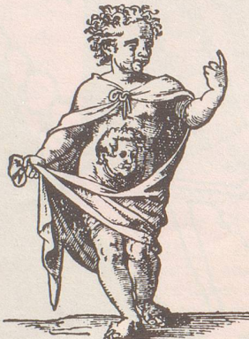
Das Bild links zeigt eine geschlechtliche und das Bild rechts eine ungeschlechtliche Vermehrung mittels Knospung. Letzteres ist ein Stich aus dem Jahre 1580.