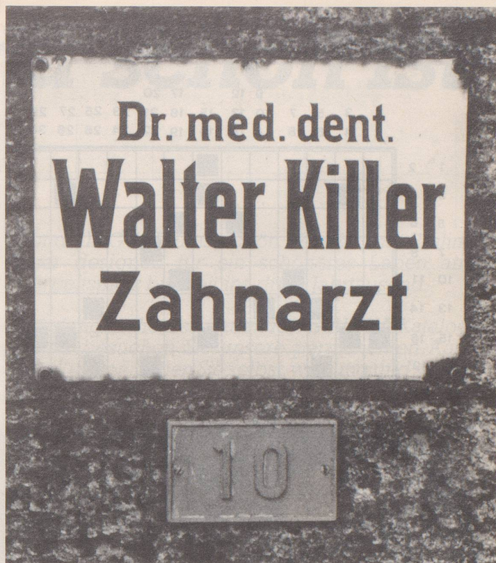
«Das ist ja zum Lachen... Was? Sie haben immer noch Angst vor dem Zahnarzt?!»

Punkt acht Uhr betrat Herr Schmelz die Praxis von Dr. Bohrowski. Er sollte ruhig schon mal Platz nehmen, hiess es, der Doktor sei leider noch nicht da. Der Doktor komme gleich, meldete die Assistentin nach zehn Minuten, er habe keinen Parkplatz gefunden. Mein Gott, durchfuhr es Herrn Schmelz, dieser Bohrowski wird doch nicht ... Gelähmt vor Schreck startete er auf die Tür. Sie öffnete sich, und herein kam das Rindvieh.