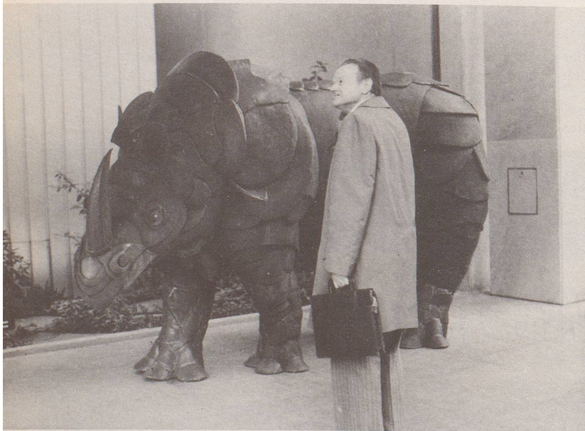
5. ... die Bestien des Urwaldes durchstreifen den Dschungel der Grossstadt.