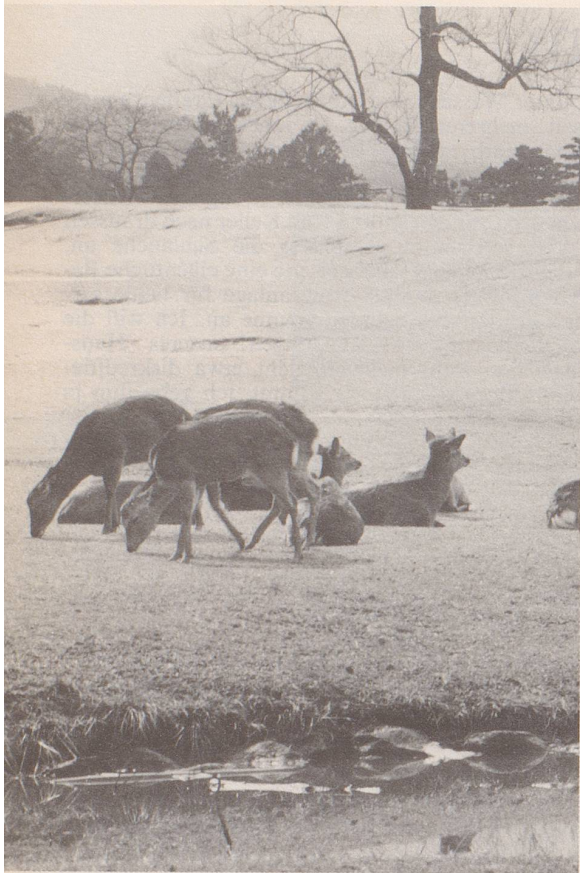
1. Tiere, die einstmals wild in der freien Natur lebten ...