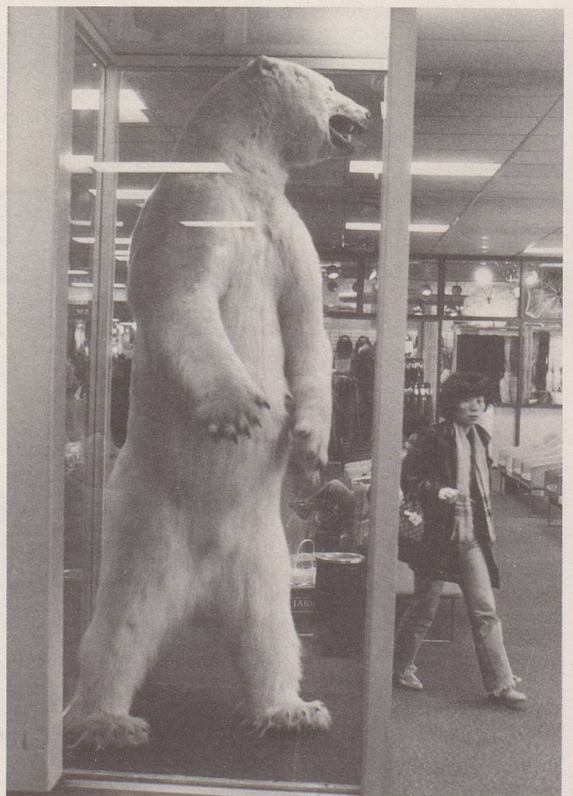
6. Richtig gehalten, gedeihen wilde Tiere im Schutz des Menschen weit besser als in der Wildnis.