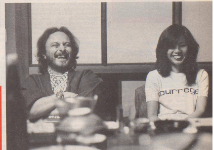
10 1986: Dank Elektronik ist die Belegschaft froher, glücklicher und aufgeregter, was die Hersteller der süsseren Geräte schon seit je prophezeiten. Das Bild entstand an einem Montagmorgen um 7 Uhr 09, eine Minute vor Arbeitsbeginn, im Grossraumbüro einer Zürcher Bank.