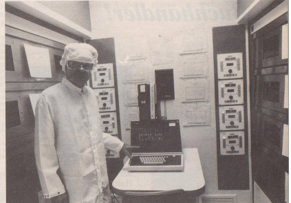
7 1982: Yves St. Laurent stellt die neue Office-Mode vor, welche die Störung der Computer durch Schuppen und andere vom menschlichen Bedienpersonal herrührende Fremdkörper verhindert.