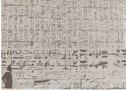
1 1480 v. Chr.: Alles begann mit diesem ersten alltäglichen Schreibblock von Ramses II., den Archäologen im Tal der Könige bei Luxor ausgruben. Das Fundstück enthält im wesentlichen eine Anweisung an Ramses Sekretärin, den Pausen nicht so heiss zu servieren.