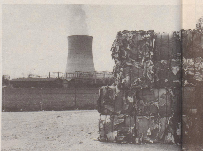
9 1994: Die papierlose Bürokommunikation ist in den USA Realität. Im Bild die Anlage bei Los Angeles, in welcher das letzte Büroapier verbrannt und damit Strom für die Computer der Metropole produziert wird.