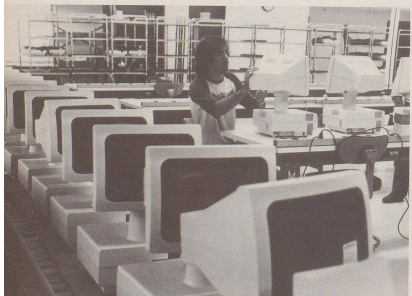
8 1993: Dank Sonderanstrengungen in den Herstellerwerken im Silicon Valley kann das Ziel «jeder Sekretärin ihren Bildschirm» beinahe erreicht werden.