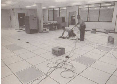
4 1953: Das gleiche Büro zwei Jahre später, kurz vor der Montage des ersten Computers (IBM, Modell Pionier I, 15 Tonnen).