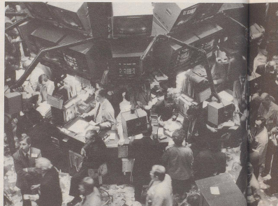
5 1975: Inzwischen ist im selben Büro ein Mehrplatzsystem installiert worden, das «optimale Arbeitsabläufe bei höchstmöglichem Komfort bietet» (Zitat aus einem Inserat der Herstellerfirma).