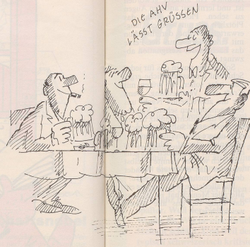
2. Es drängt sich auf, alkoholische Getränke gratis auszuschenken, statt via Alkoholsteuer Geld in die AHV zu pumpen.