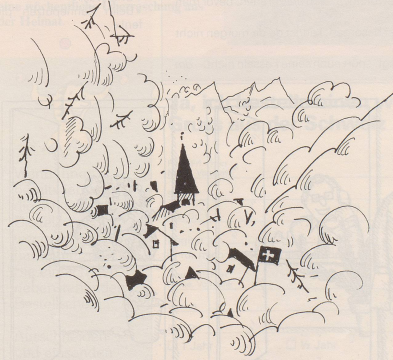
6. Alle Massnahmen gegen das Waldsterben sind sofort einzustellen.