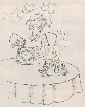
3. Die Aufschrift auf den Zigarettenpackungen «Rauchen kann Ihre Gesundheit gefährden» wird durch einen neuen Aufdruck ersetzt.