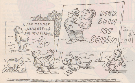
1. Durch Bundesgesetze sind die Voraussetzungen für eine prohibitive Besteuerung von Reklamen für gesunde Produkte, Schlankheitsdiäten usw. zu schaffen, während Reklamen wie diese grosszügig subventioniert werden sollten.

Prognosen deuten darauf hin, dass die AHV bis zum Jahr 2000 pleite sein könnte. Zunehmende Lebenserwartung, lebensverlängernde Erfolge der Spitzenmedizin, Gesundheitsbewegungen wie Aerobic, Jogging und Bodybuilding werden zur Folge haben, dass immer mehr AHV-Bezüger immer weniger Beitragszahler gegenüberstehen. Die Finanzierung der AHV wird von Jahr zu Jahr schwieriger. Damit die langfristigen Perspektiven dieses grossen Sozialwerks wieder etwas rosiger gestaltet werden können, sind schon heute vom Bund neue und zielgerichtete Massnahmen zu fordern. Hans Moser hat diesen Massnahmenkatalog erdacht und illustriert.