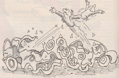
5. Auf allen Strassen ist nur noch die Minimalgeschwindigkeit verbindlich. Die Gurtentpflicht wird aufgehoben.