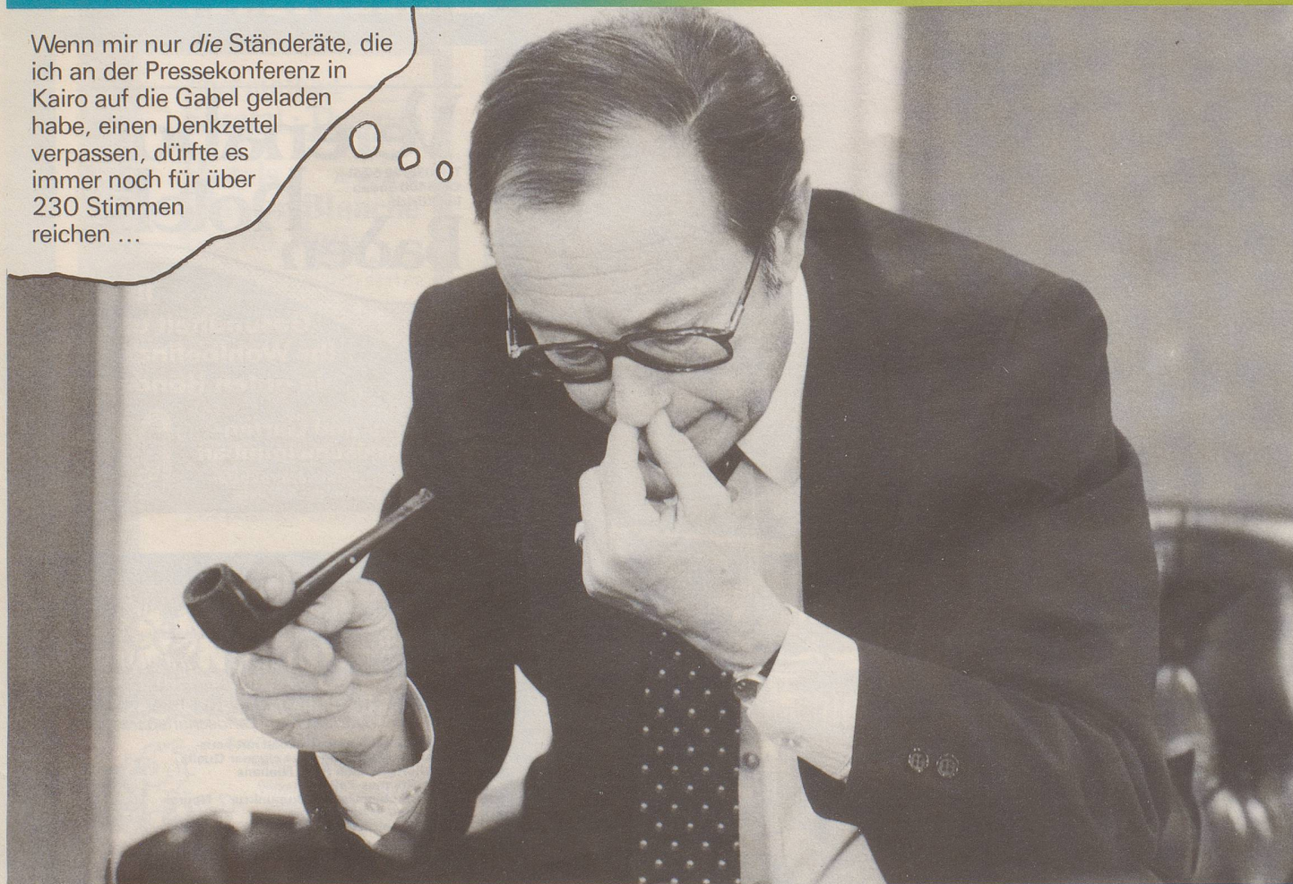
Bild (Bundesrat Pierre Aubert wartet auf das Ergebnis für seine Wahl zum Vizepräsidenten des Bundesrats)