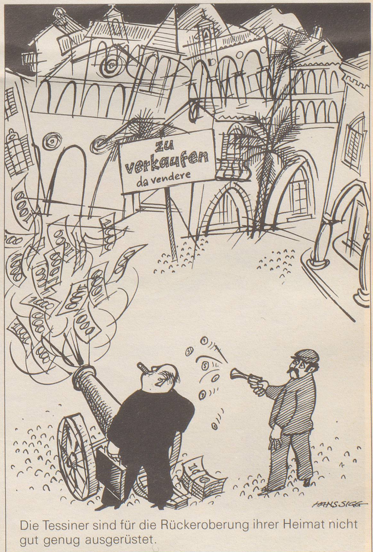
Die Tessiner sind für die Rückeroberung ihrer Heimat nicht gut genug ausgerüstet.