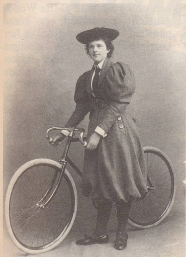
Diese flotte junge Dame im damals als «äusserst schockierend» taxierten Velocipedistinnen-Hosenrock war eine der ersten radfahrenden und enragierten Radfahrerinnen der Schweiz. Unsere Aufnahme datiert aus dem Jahr 1896.

Wie man vernimmt, hat sich soeben in Bern ein Club gebildet, der sich auf einem Velociped einüben und dann in der schönen Jahreszeit Cavalcaden, vielleicht auch ein Wettrennen mit den Droschken, veranstalten wird. Auch zu Samaden im Engadin gibt es Velocipedomanen.»