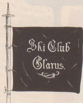
Am 22. November 1893 wurde in Glarus von 13 «Schneeschuhläufern» der Sektion Tödi des Schweizerischen Alpen-Clubs der Ski-Club Glarus als erster Ski-Verein der Schweiz gegründet. «Die Fahne (so schildert uns Max Senger in seinem erschienenen Buch «Wie die Schweiz zum Skiland wurde») war an einem Skistock befestigt und bestand aus reiner Seide. Sie wurde überall hin genommen.»