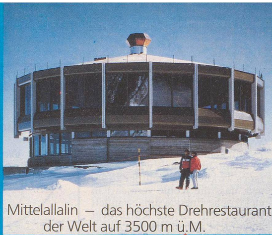
Mittelallalin – das höchste Drehrestaurant der Welt auf 3500 m ü.M.