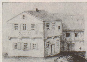
Schillers Geburtshaus in Marbach

In dieser prachtvollen 7bändigen Ausgabe finden Sie Schillers berühmteste Werke: eine ungekürzte Auswahl aus der sogenannten «Kleinen Stuttgarter Schillerausgabe der Cottaschen Hofbuchhandlung». Alle 7 Bände komplett zu einem phantastischen Preis: nur