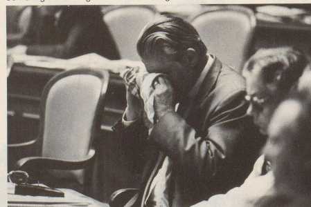
Trotzdem, Politiker haben's schwer: Tapfer müssen sie sein, ...