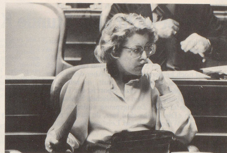
Bestimmt aber nicht von sitzenlassen.