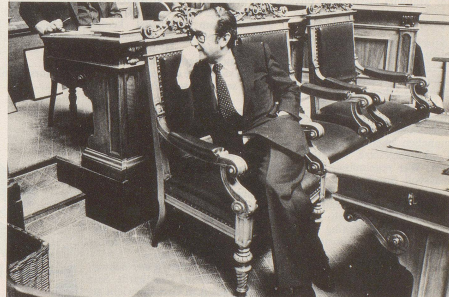
... denn die Belohnung winkt: Sitzleder.