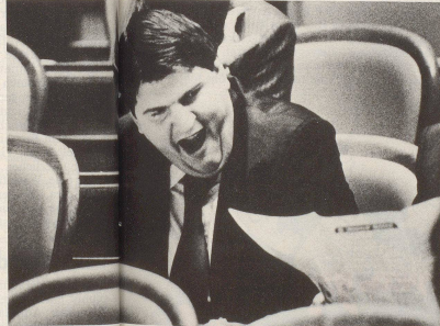
Deshalb gibt's nur eines: Durchhalten ...