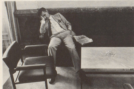
So richtig sitzen ist ganz schön anstrengend.