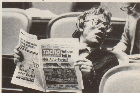
... und viiiiiii lesen. Weitersagen!