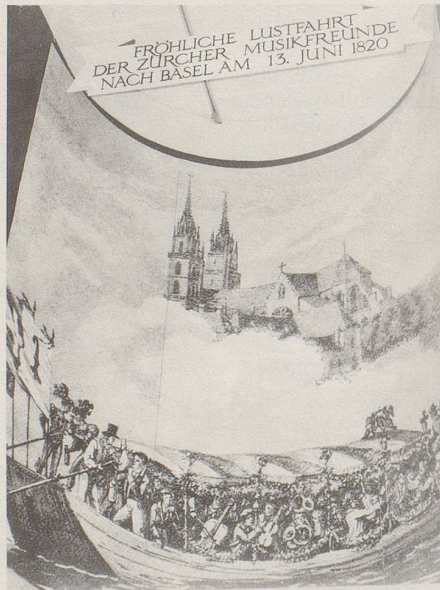
Bekannt ist die legendäre Zürcher Hirsenbreifahrt nach Strassburg. Basel war damals aber nur Station auf dem Wege, den der heisse Topf zu elsässischen Mäulern nahm. Jene Zürcher Musikanten jedoch, die im Sommer 1820 in die Rheinstadt kamen, machten ihren blumengezierten Kahn, freudig begrüsst von Basler Böllerschüssen auf der Pfalz, definitiv am Grossbasler Ufer fest.