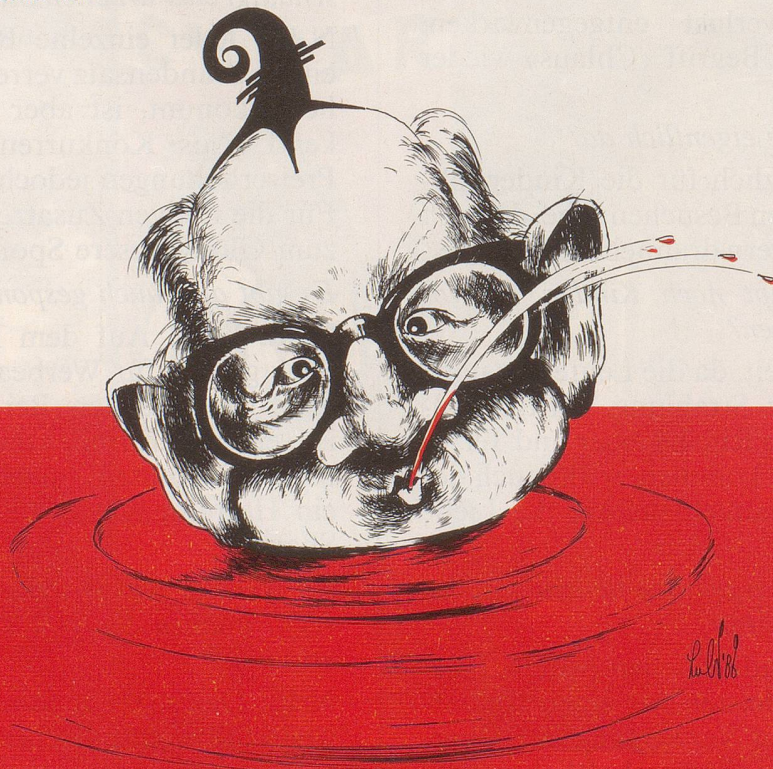
Rhein oder nicht rein ...