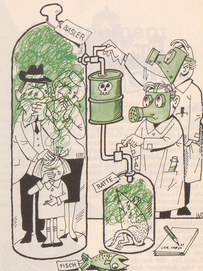
Die Firma Sandoz will mit Tierversuchen die möglichen Langzeitfolgen des Chemie-Grossbrandes testen.

Alles in allem war die selbstlose Sandoz-Aktion also alles andere als ein Schlag ins Wasser. Die Unternehmensleitung und die PR-Fachleute des Konzerns haben mit ihrem verantwort-