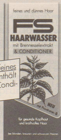
für feines und dünnes Haar

NEU: FS Haarwasser für feines und dünnes Haar enthält zusätzlich einen haarpflegenden Conditioner für mehr Halt und Fülle.