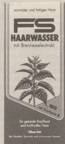
für normales und fettiges Haar

FS – das Haarwasser mit Brennesselextrakt.