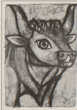
z. B. Stier (21.4.–20.5)

Jedes Sujet in limitierter Auflage von 150 Blättern. Jedes Blatt vom Künstler handsigniert und numeriert. Büttenpapier, Format 65 x 50 cm, je Fr. 480.–