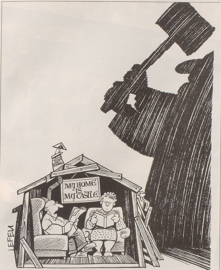
«Was meinst du, Emmi, was macht die Gesetzgebung aus dem Mieterschutz -?»