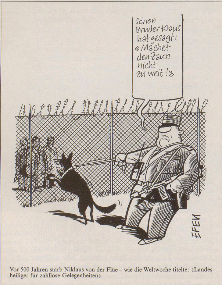
Vor 500 Jahren starb Niklaus von der Flüe – wie die Weltwoche titelte: «Landesheiliger für zahllose Gelegenheiten».