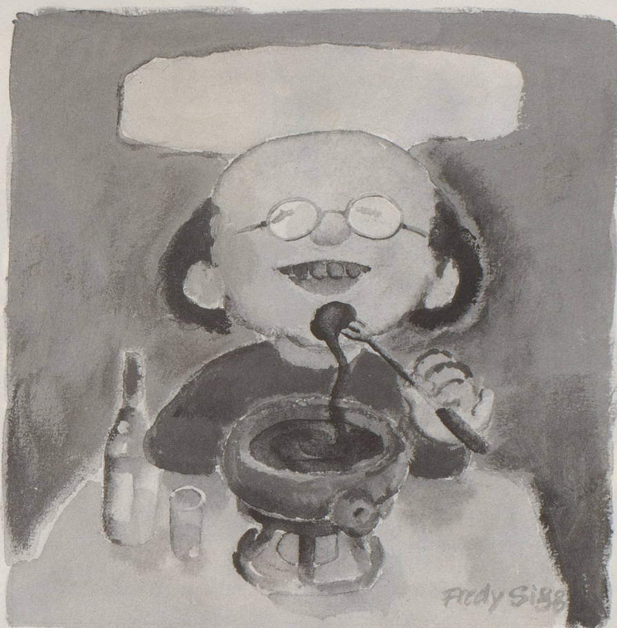
Walliser Spezialität der Saison: Skiwachsfondue à la mode de Zurbriggen