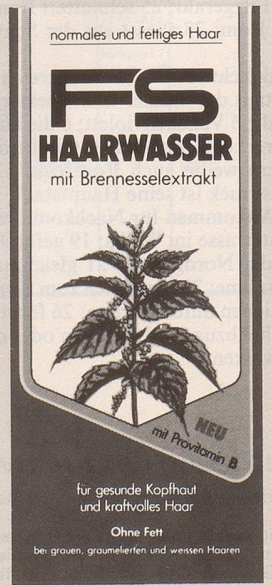
für normales und fettiges Haar.

Beide Sorten gibt es auch für blondes, braunes und schwarzes Haar.