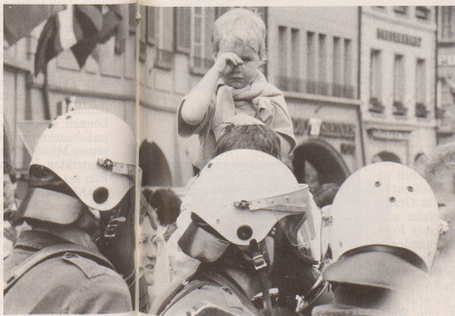
... ob nur vor der Polizei alle Schweizer gleich sind ...