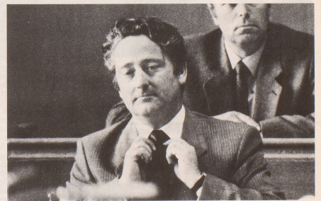
... oder auch vor dem Gesetz.