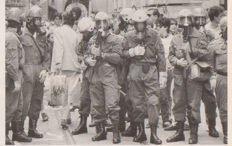
... und ausserdem: Gelegentlich haben auch zufällige Passanten Überlebenschancen.