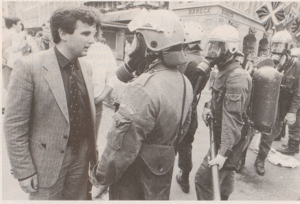
Meinungsverschiedenheiten werden in Bern ...

Dokumentiert von den beiden Bernern Michael von Graffmied und Ueli Schmeizer am Beispiel der Berner Tschernobyl-Demonstration.