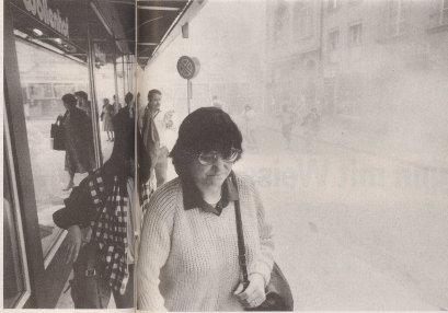
... Tränen kommen einem beim Einkaufen nur der hohen Preise wegen ...