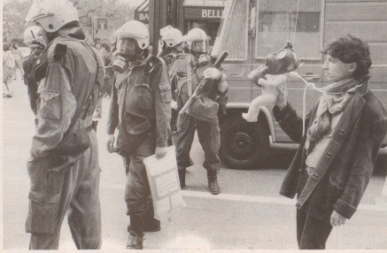
Trotzdem: Der Einsatzleiter war nicht der zweite von rechts ...