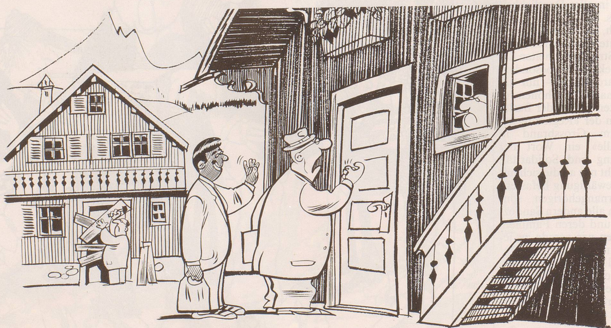
«Aufmachen im Namen des Bundes: Ich bringe Ihnen Ihr persönliches Flüchtlingskontingent!»