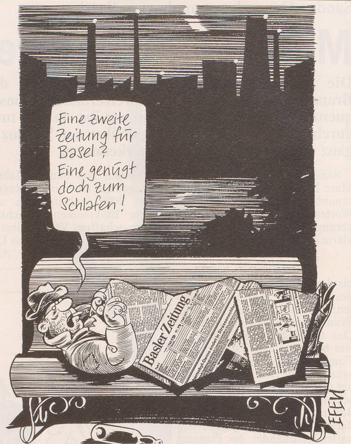
Lanciert das Haus Ringier in Basel eine zweite grosse Tageszeitung? Der Entscheid dazu soll im Lauf des Sommers fallen.